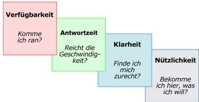
Abbildung 2. Vier Dimensionen der Anwendungseffektivität)

In diesem Dokument konzentrieren wir uns auf den zweiten Schlüsselwert, die Conversion-Rate . Diese zeigt, ob den Kunden, die die Seite besuchen, ein effektiver Service geboten wird. Dazu muss eine Site oder Anwendung die vier in Abbildung 2 dargestellten Anforderungen erfüllen: Verfügbarkeit , Antwortzeit , Klarheit und Nützlichkeit . Jeder dieser Faktoren ist für den Erfolg der Webseite unabdingbar. Die Web 2.0-Umgebung bietet neue Möglichkeiten zur Erfüllung dieser Ziele. Doch kommen dabei auch neue Herausforderungen hinzu.